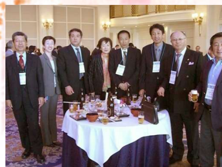
創立40周年記念総会時